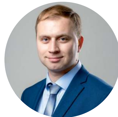
Чекушов Роман Андреевич Директор департамента международной кооперации и лицензирования в сфере внешней торговли Министерства промышленности и торговли РФ