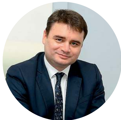
Осьмаков Василий Сергеевич Первый Заместитель Министра промышленности и торговли РФ