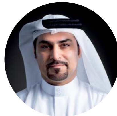
Фахад Аль Гергави Генеральный директор дубайского центра инвестиционного развития