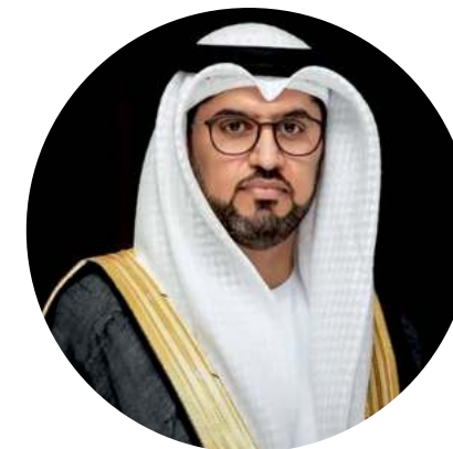
Мохаммад Ахмад Аль-Джабер Посол ОАЭ в России